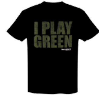
I PLAY GREEN TEE- SHIRT