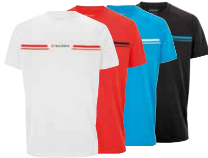
F1 COOL POLO