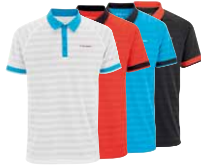
F3 X-COOL POLO