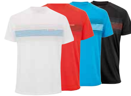
F2 AIRMESH POLO